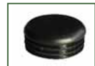
Tapón para Poste P/N 225-76902-04