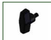
Tornillo Manual P/N 225-76901-04