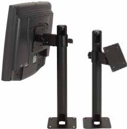
Postes de montura para monitores, Altura 17", con brazo de 4" P/N: 225-76110-04