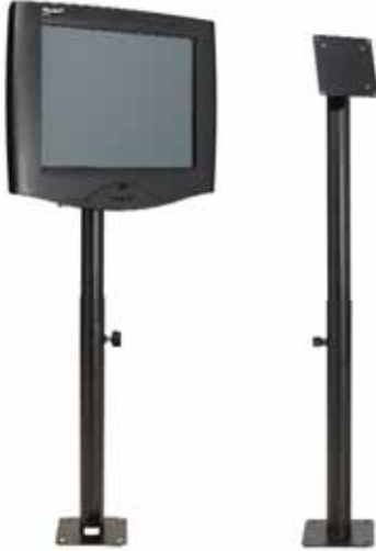
Postes telecopio de montura para monitores, Altura 18" - 30" P/N: 225-76120-04